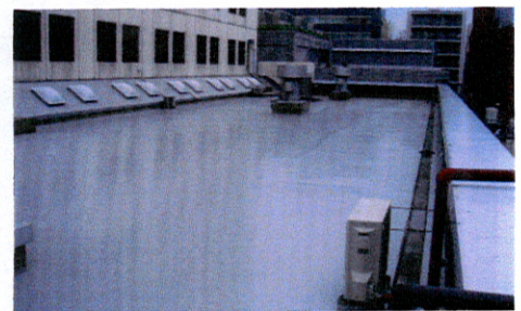
高橋担当でした。 四家記

㎡行なうから、大同塗料のヤネクルUで完成した。今後は都心部の温暖化予防に貢献するこ