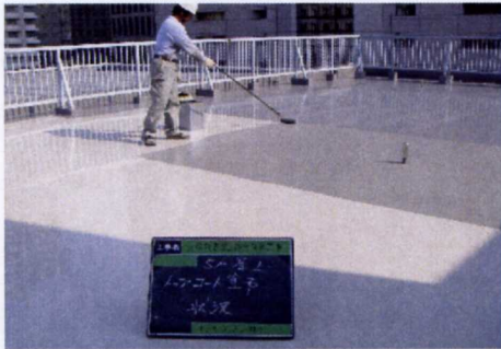
(10)、トップコート塗布