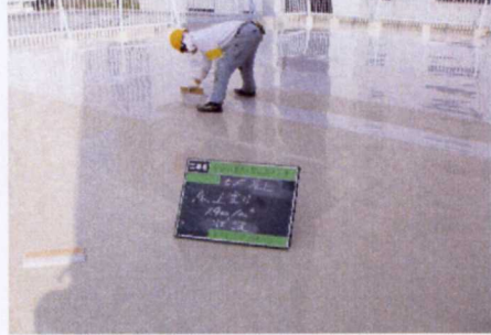
(9)、ウレタン防水上塗りHCエコブルーフェ