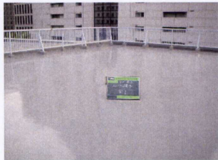
(11)、ウレタン防水完了