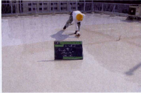
(8)、ウレタン防水中塗りHCエコブルーフェ